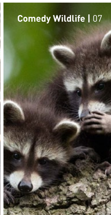
Comedy Wildlife | 07