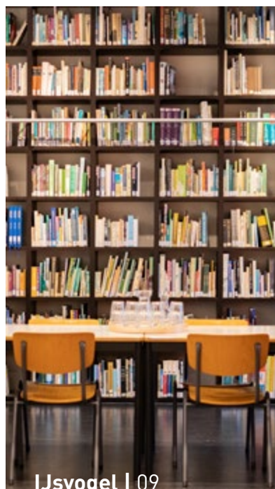
IJsvogel | 09