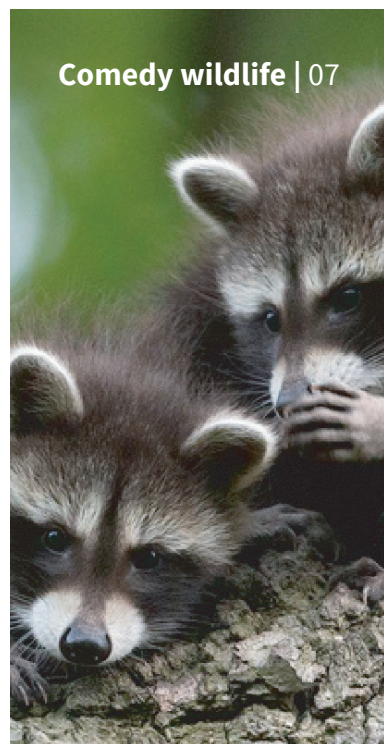
Comedy wildlife | 07